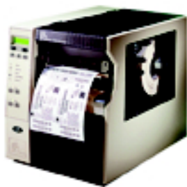
Stampante Z170XIII Plus

APPLICAZIONE STAMPA SUBITO ON LINE Stampa ed applicazione on-line dell'etichetta logistica